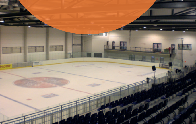
Eishalle, 2007 von der PlanerVilla AG als Generalplaner errichtet