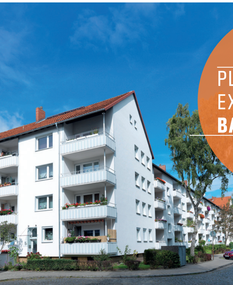
Zustand nach der Sanierung