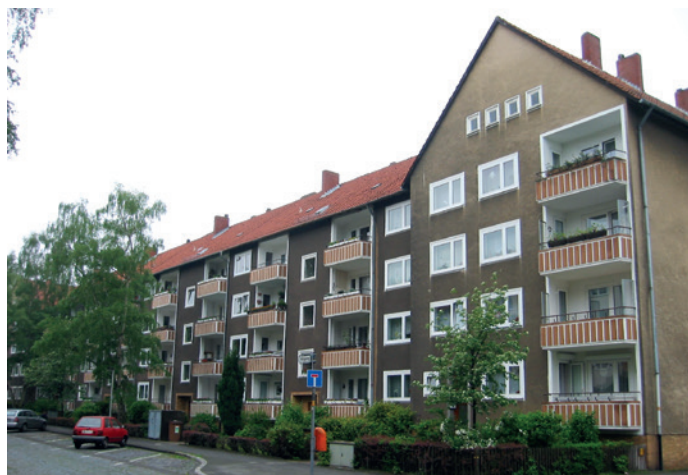
Zustand vor der Sanierung

Die PlanerVilla AG begleitet die BAUM Unternehmensgruppe seit mehr als 15 Jahren erfolgreich bei Themen wie Sanierung von Wohngebäuden, Beantragung von Fördermitteln und auch bei der Unterstützung von Projektentwicklungen in Deutschland.