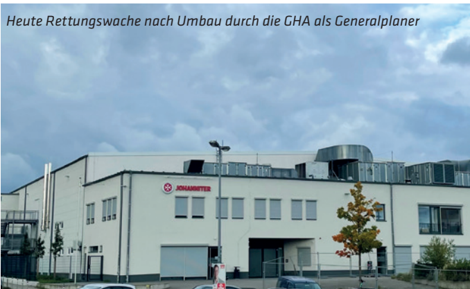
Heute Rettungswache nach Umbau durch die GHA als Generalplaner

Ein Beispiel hierfür ist die von der PlanerVilla AG 2007/09 geplante und gebaute Eissporthalle in Hannover-Langenhagen. Nach längerem Leerstand wurde sie von GUDER HOFFEND Architekten aufwändig zu einer der größten und modernsten Rettungswachen mit angegliedertem Katastrophenschutz Norddeutschlands aus- und umgebaut. In einer Bauzeit von nur rund neun Monaten wurde das Gebäude 2022 komplett umgebaut und steht heute für 51.000 Menschen zur notfallmedizinischen Versorgung zur Verfügung.