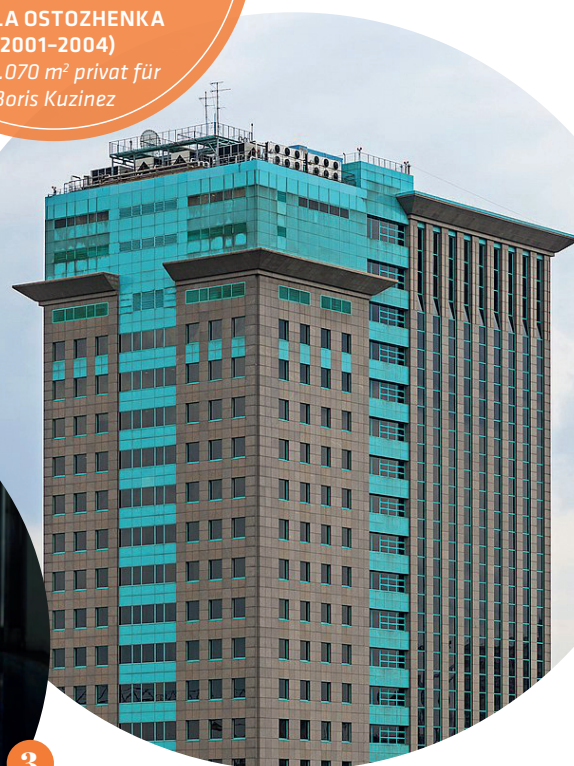
Unternehmen Yukos Oil